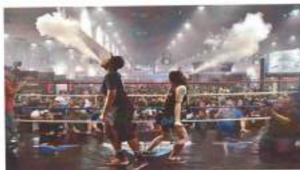
Рис. 2. Вейпинг соревнования

Быстрому распространению курения ЭС (вейпингу) способствуют компании-производители, которые превратили курение ЭС в целую субкультуру. В мире на регулярной основе проводятся субсидируемые компаниями-производителями выставки и соревнования среди курильщиков ЭС (рис.2). Это так называемые: «Cloudchasing» (мастерство выдувания облаков пара), «Tricks» (трюки с паром) и «Вейпинг-алхимия» (соревнования по составлению новых жидкостей для вейпа).