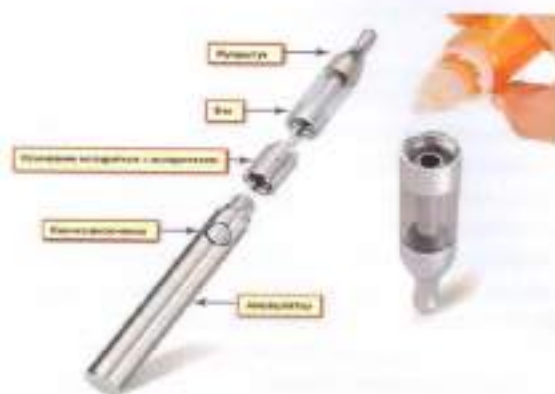
Рис.3. Устройство электронной сигареты

Обычная электронная сигарета состоит из аккумулятора, электрического испарителя, емкости для жидкости, мундштука и дополнительных элементов для автоматического управления подачей ароматизированной жидкости (но последние имеются не во всех моделях), рис.3.