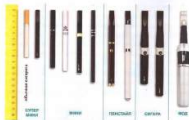
Рис.4. Типы и размеры электронных сигарет

Электронные сигареты (вейпы) классифицируются также по типу и размеру (рис.4) в соответствии с длиной (от 82 мм до 175 мм).