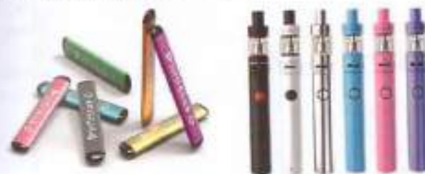
Рис. 5. Одноразовые (слева) и многоразовые (справа) электронные сигареты

Одноразовые ЭС рассчитаны на 200 - 500 затяжек пара. В многоразовых устройствах нет таких ограничений и они работают до тех пор, пока доливается жидкость в емкость.