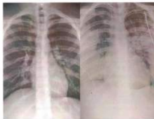
Рис.6. Здоровые легкие (слева) и легкие после 5 дней использования вейп-устройства

как: «Повреждение легких, связанное с употреблением электронных сигарет или продуктов вейпинга». Данное заболевание будет внесено в МКБ-11, а пока CDC рекомендует кодировать эту болезнь другими подобными заболеваниями. EVALI может отражать спектр болезненных процессов, а не один конкретный процесс. Отдельные сообщения о заболеваниях легких, связанных с вейпингом, описывают острую эозинофильную пневмонию, диффузное альвеолярное кровоизлияние, липоидную пневмонию, и респираторный бронхит, ассоциированный с интерстициальным заболеванием легких (рис.6).